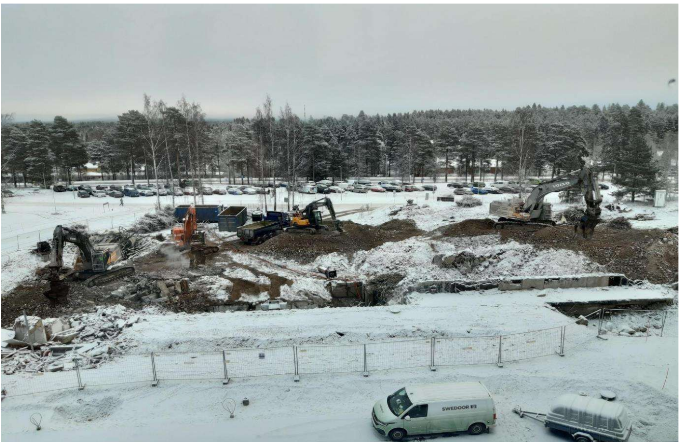
Aika aikaansa kutakin. Kainuun keskussairaalan purkutyömaa 9.11.2022.

Kainuun sosiaali- ja terveydenhuollon kuntayhtymän tarkastuslautakunta kiittää johtavia viranhaltijoita ja muita lautakunnan kuultavana olleita toimihenkilöitä hyvästä yhteistyöstä vuonna 2022.